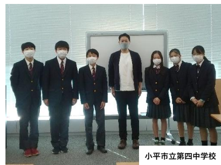
小平市立第四中学校