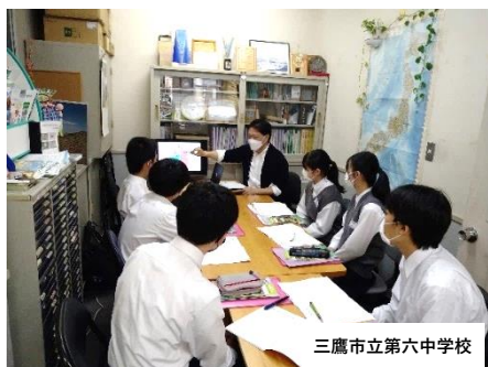
三鷹市立第六中学校