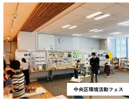
中央区環境活動フェス