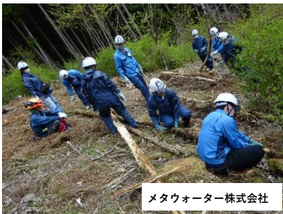
メタウォーター株式会社