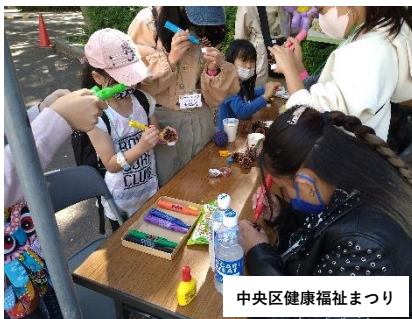
中央区健康福祉まつり