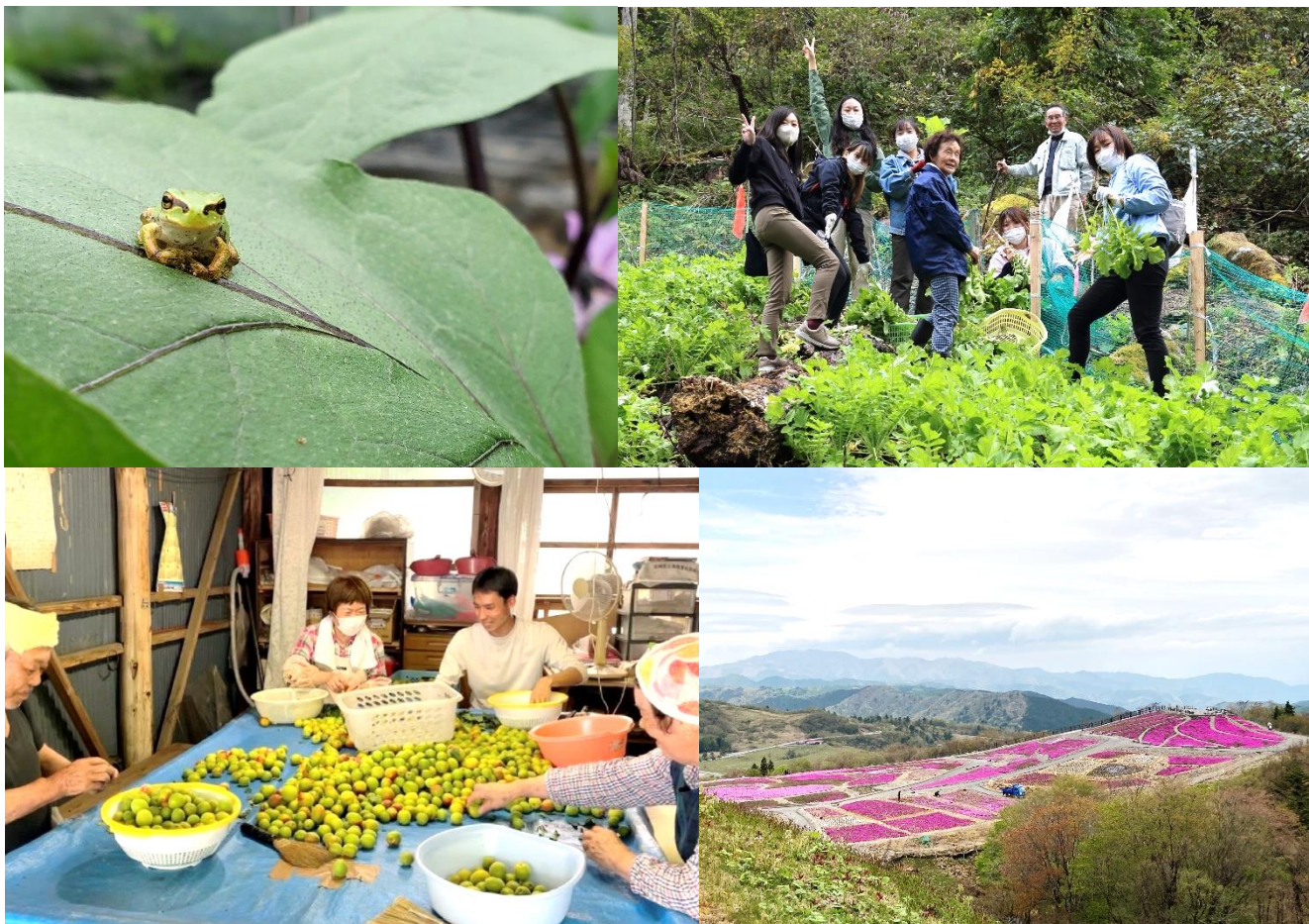
第 28 期緑のふるさと協力隊活動写真より