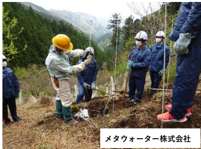
メタウォーター株式会社