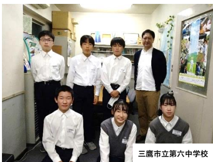
三鷹市立第六中学校