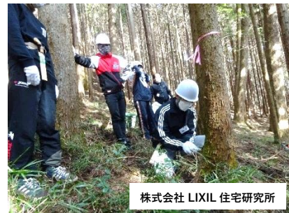
株式会社 LIXIL 住宅研究所