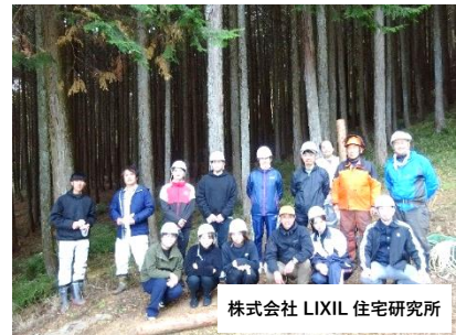
株式会社 LIXIL 住宅研究所