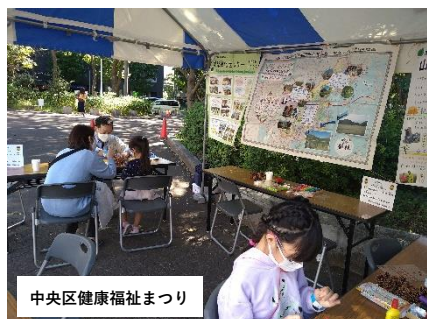
中央区健康福祉まつり