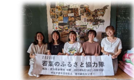
2023年 若葉のふるさと協力隊 高尾：東京都豊田村 研修：2023年6月18日～8月22日 特定非営利活動法人 地球緑化センター